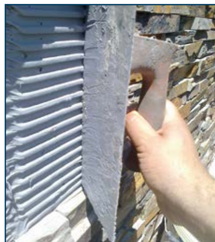
Colagem de xisto ou ardósia no exterior

Cuidados na selecção para evitar patologias: