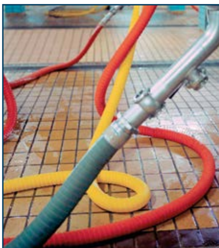
Colagem em ambientes altamente agressivos