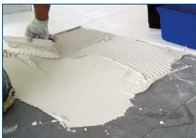
Pavimentos e revestimentos interiores