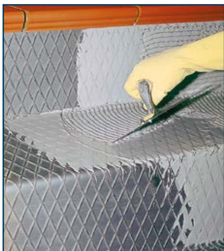
Colagem sobre suportes metálicos e ou deformáveis