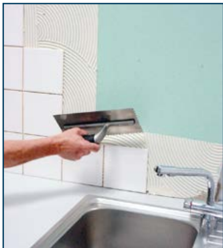
Colagem sobre gesso cartonado