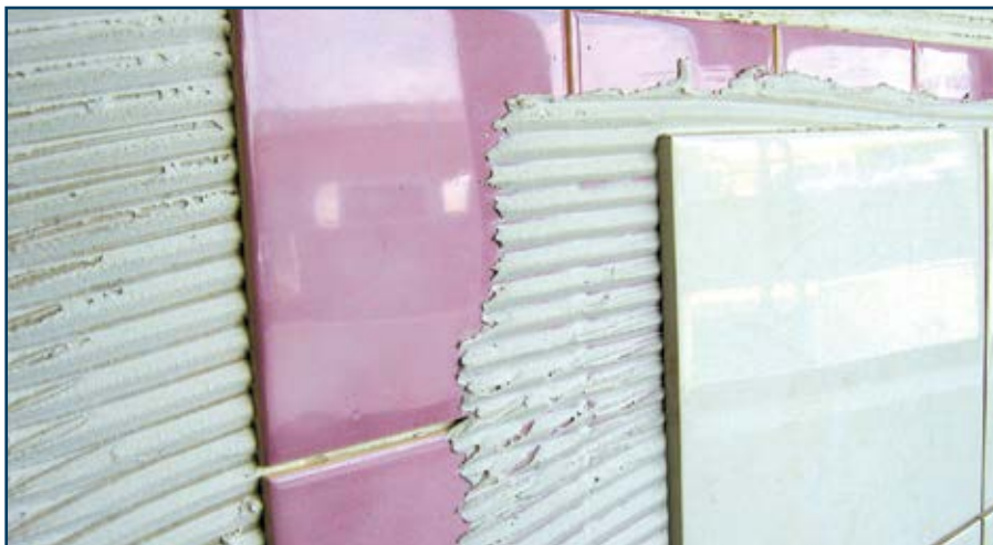
Colagem de cerâmica absorvente sobre azulejo

Cuidados na selecção para evitar patologias: