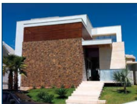
Fachadas com revestimento pétreo