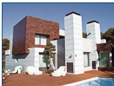
Fachadas com revestimento cerâmico